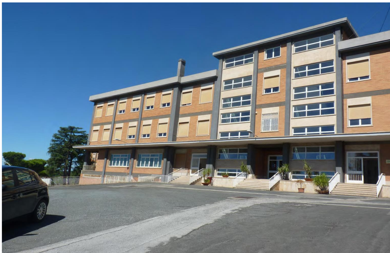
ingresso della 1a Compagnia