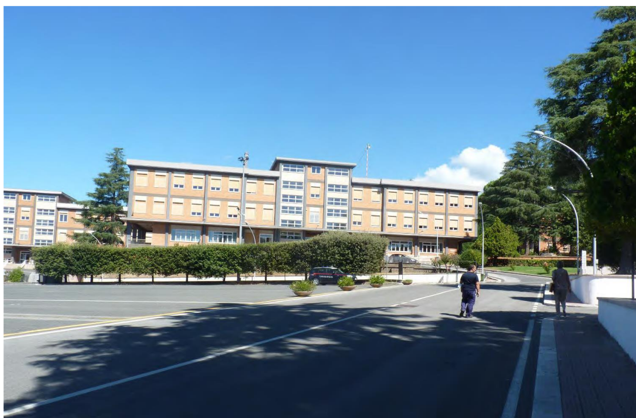
Prospetto della 1a Compagnia