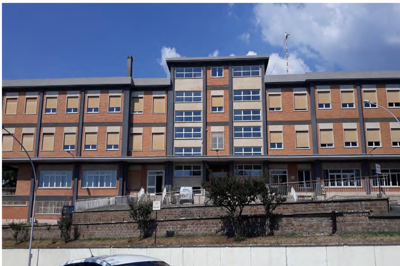
ingresso della 3a Compagnia