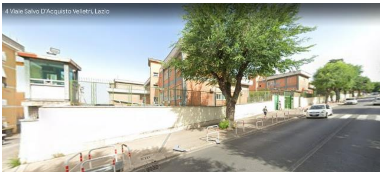
4 Viale Salvo D'Acquisto Velletri, Lazio