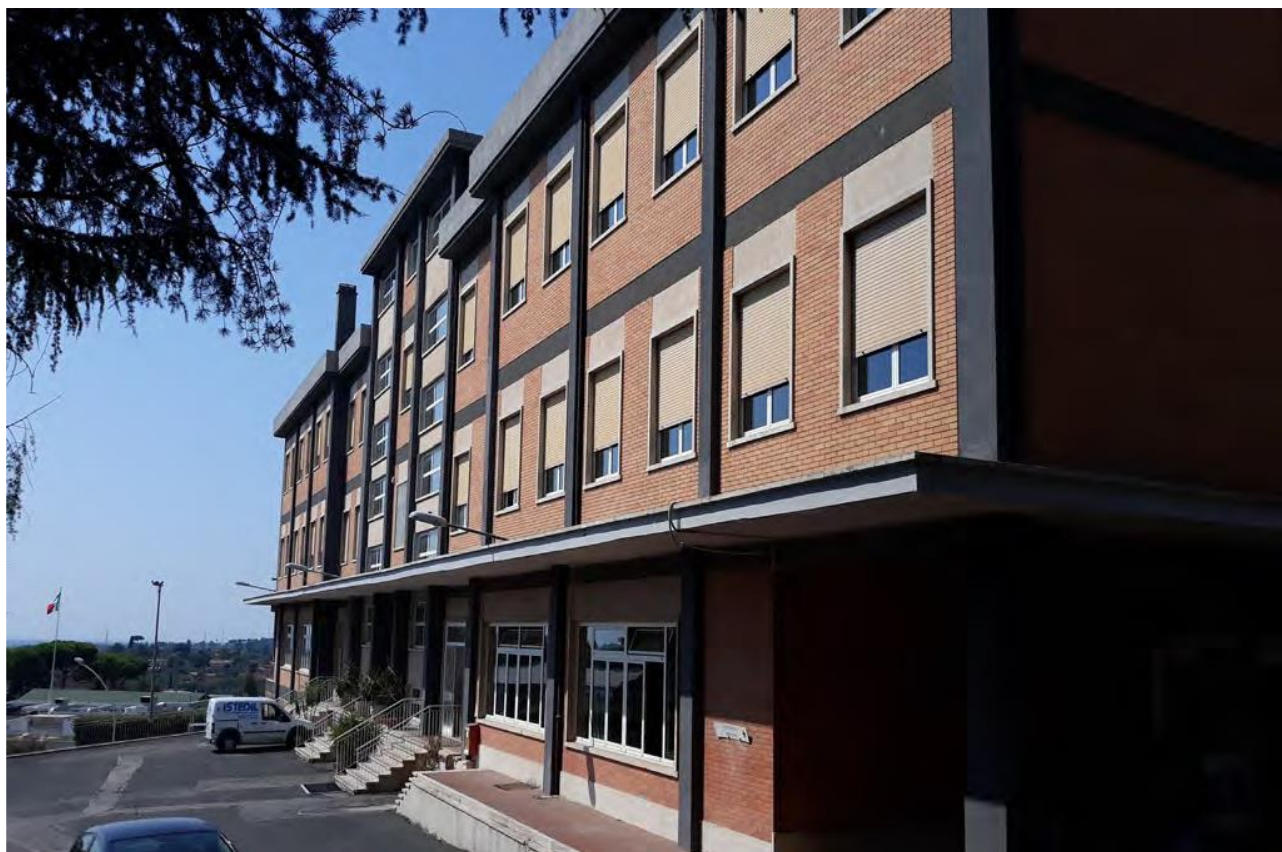
vista laterale ingresso della 3a Compagnia